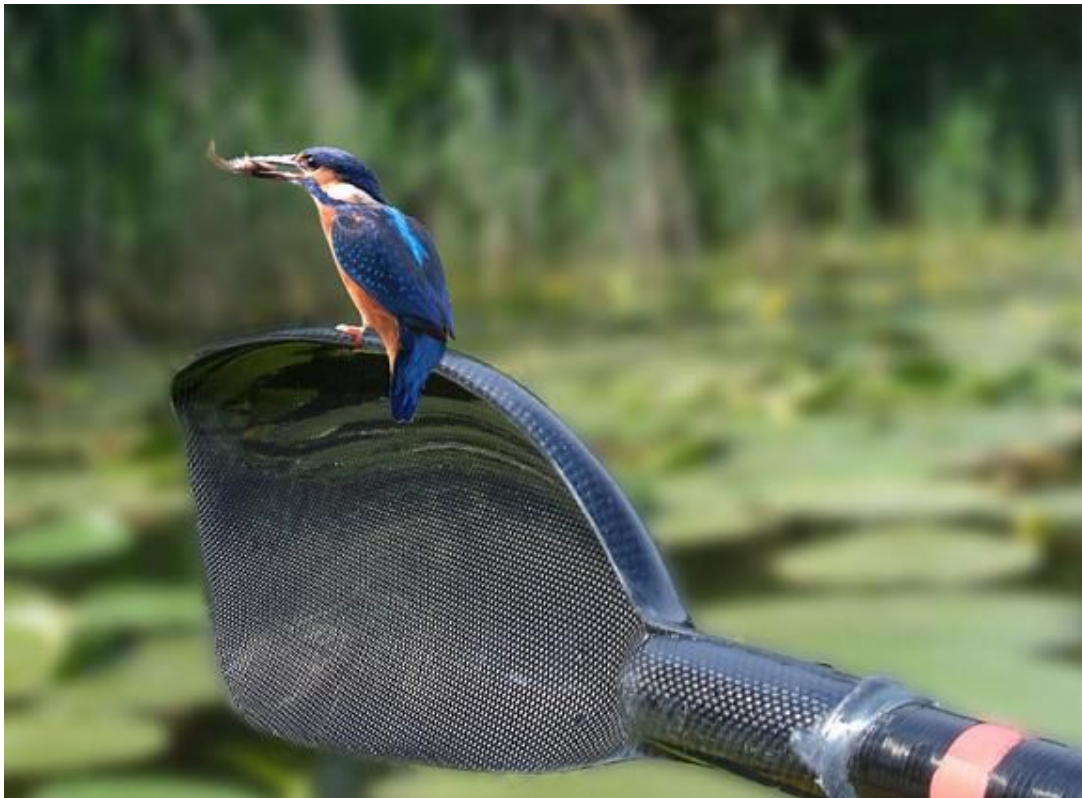
Selvom isfuglen er både sky og hurtig, kan den alligevel opleves i den skønne natur omkring klubben. (fotokomposition af Thranum)